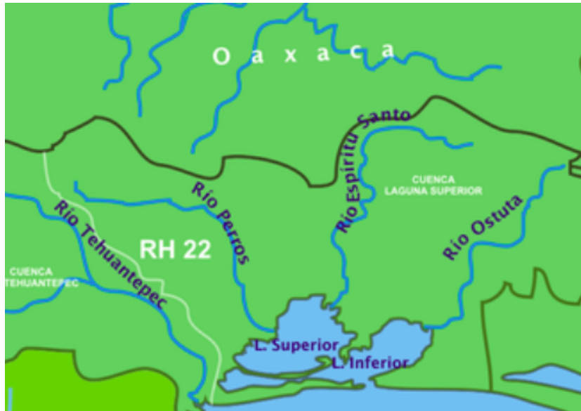
Figura 2 – Principales ríos que desembocan en el Pacífico.

No se necesita ser gran amante de la naturaleza para quedar asqueado ante la visión de basura y todo tipo de desperdicios amontonada en multitud de recodos de nuestros ríos. Un mero acto de autoestima debería llevarnos a no tirar basura y más aún, a recogerla cuando la vemos. Lamentablemente no es así, desde el transporte público, en las calles y hasta en la casa, la mayoría de las personas tiran basura.